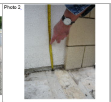
Trace du maximum de la crue sur le mur du portail

MARQUE --- Texte : 46 rue de Nancy commune Brin-sur-seille Maximum de l'inondation : Oui