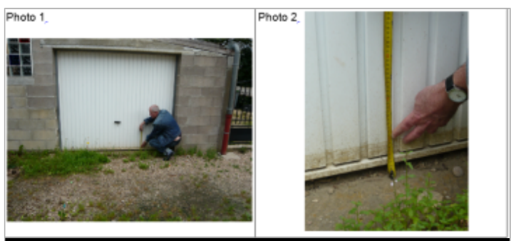
Trace sur la porte du garage

MARQUE Texte : rue de la Gare Brin-sur-Seille Maximum de l'inondation : Oui