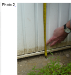
Trace sur la porte du garage