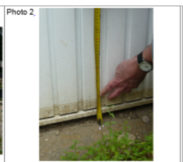
Trace sur la porte du garage

MARQUE Texte : rue de la Gare Brin-sur-Seille Maximum de l'inondation : Oui