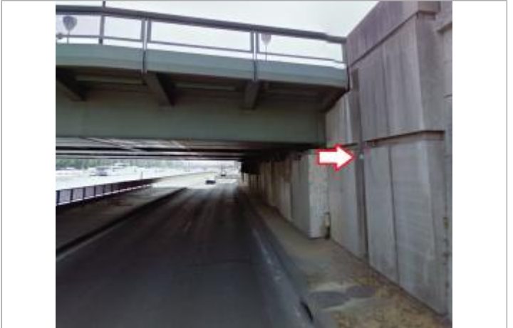
Vue du site - source : Google Street View (2011)

GÉOLOCALISATION Coordonnées WGS84 : X: 2.30148638 / Y: 48.86281430 Coordonnées RGF93 (Lambert 93) : X: 648754.22 / Y: 6862757.96 Coordonnées RGF93 (ETRS89) : X: 2.3014864 / Y: 48.8628143 Code Hydro : ----0010 Rive de référence : Gauche