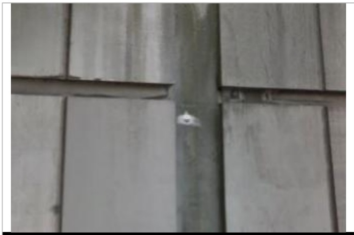
Vue du repère - Source : Google Street View (2012)

MARQUE Maximum de l'inondation : Oui Visibilité : Oui État du repère : Bon Pérennité : Longue Repère calculé : Oui