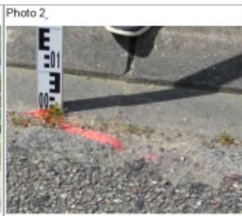
Trace du maximum de la crue sur la route face au 2 rue de l'Yron commune de Ville-sur-yron (moulin)