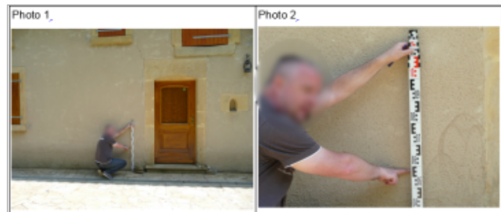
Trace du maximum de la crue sur la façade à coté de la porte d'entrée du 2 rue de l'Yron commune de Ville-sur-Yron

GÉNÉRAL Code : WEB_R_201810122218 Date de mise à jour : 06/09/2019 Auteur : DDT54_PR-GC_MH