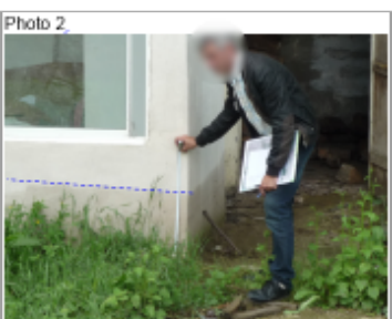
Trace du maximum de la crue sur l'annexe vitrée en arrière de la maison du 2 rue du Château