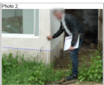
Trace du maximum de la crue sur l'annexe vitrée en arrière de la maison du 2 rue du Château