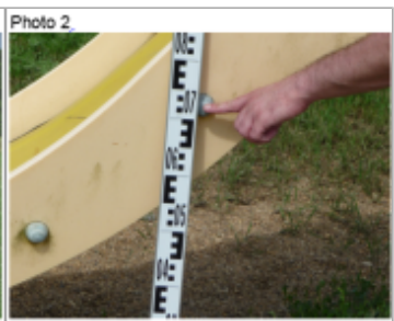
Trace du maximum de la crue sur le tobogan de la base de loisir rue de Serry

MARQUE Texte : RUE DE SERRY BASE DE LOISIRS Maximum de l'inondation : Oui