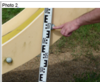
Trace du maximum de la crue sur le tobogan de la base de loisir rue de Serry

SOURCE DE REPÉRAGE : DDT 54 (JUN 2016) - 15/06/2016