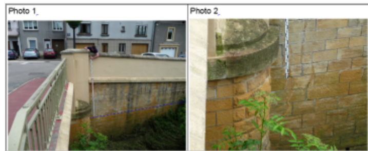
Trace du maximum de la crue sur le mur de soutènement en amont rive droite du pont de la RD130

GÉNÉRAL Code : WEB_R_201810121944 Date de mise à jour : 06/09/2019 Auteur : DDT54_PR-GC_MH