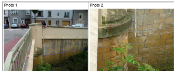
Trace du maximum de la crue sur le mur de soutènement en amont rive droite du pont de la RD130

GÉNÉRAL Code : WEB_R_201810121944 Date de mise à jour : 06/09/2019 Auteur : DDT54_PR-GC_MH