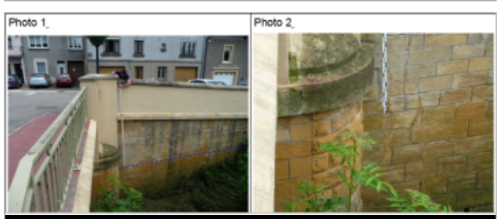
Trace du maximum de la crue sur le mur de soutènement en amont rive droite du pont de la RD130

GÉNÉRAL Code : WEB_R_201810121944 Date de mise à jour : 06/09/2019 Auteur : DDT54_PR-GC_MH