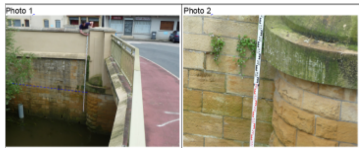
Trace du maximum de la crue sur le mur de soutènement en aval rive droite du pont de la RD 130

GÉNÉRAL Code : WEB_R_201810120543 Date de mise à jour : 06/09/2019 Auteur : DDT54_PR-GC_MH