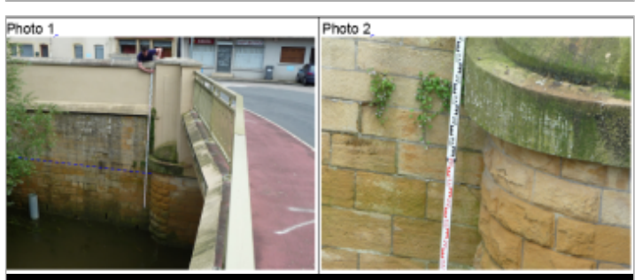
Trace du maximum de la crue sur le mur de soutènement en aval rive droite du pont de la RD 130

GÉNÉRAL ----- Code : WEB_R_201810120543 Date de mise à jour : 06/09/2019 Auteur : DDT54_PR-GC_MH