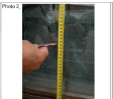
Trace du maximum de la crue sur la façade du 25 rue de Metz

SOURCE DE REPÉRAGE : DDT 54 (JUN 2016) - 15/06/2016 Type de repérage : Campagne de terrain post-inondation