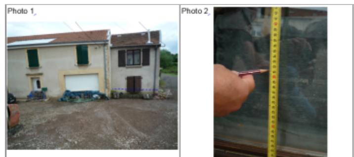
Trace du maximum de la crue sur la façade du 25 rue de Metz