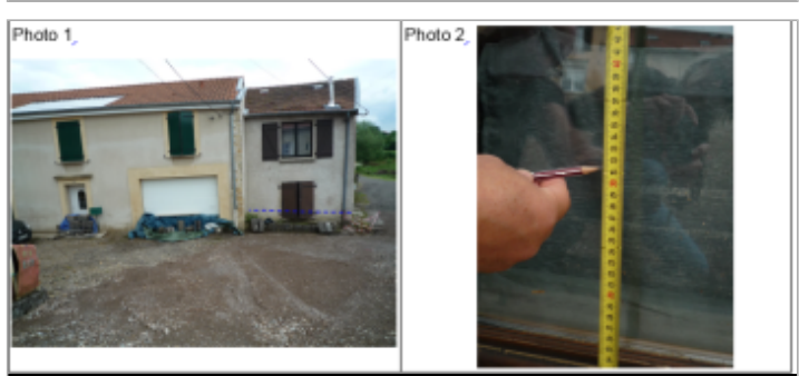
Trace du maximum de la crue sur la façade du 25 rue de Metz

GÉNÉRAL Code : WEB_R_201810125354 Date de mise à jour : 06/09/2019 Auteur : DDT54_PR-GC_MH