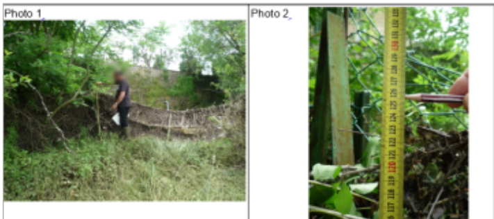
Trace du maximum de la crue sur le piquet d'angle de la clôture du 6 rue de DOUAUMONT

Texte : 6 RUE DE DOUAUMONT Maximum de l'inondation : Oui