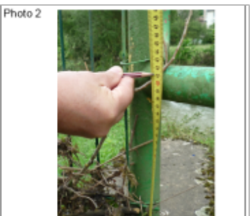
Trace du maximum de la crue sur la clôture coté rivière rue de l'Eglise

MARQUE Texte : RUE DE L'EGLISE Maximum de l'inondation : Oui