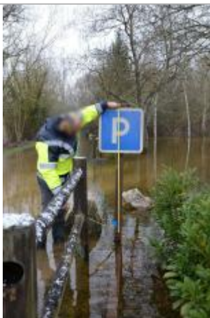
Vue de la marque - SPC SMYL