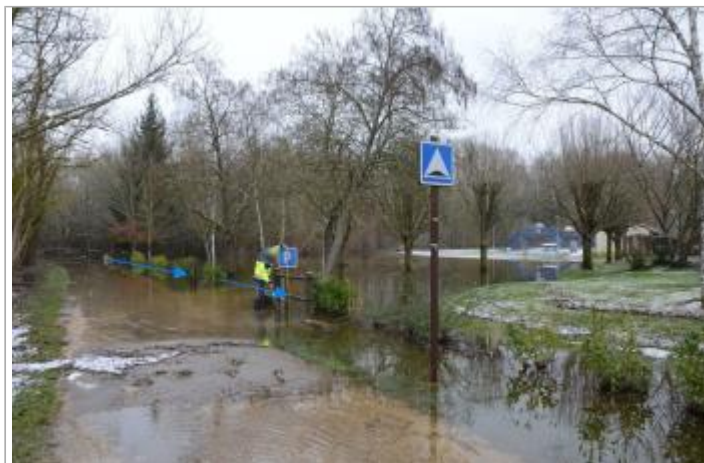
Vue du site - SPC SMYL

Coordonnées WGS84 : X: 3.11823800 / Y: 48.40004300