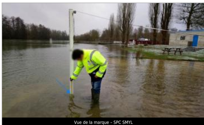
Vue de la marque - SPC SMYL