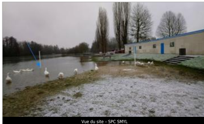
Vue du site - SPC SMYL

Coordonnées WGS84 : X: 3.24611000 / Y: 48.41486000