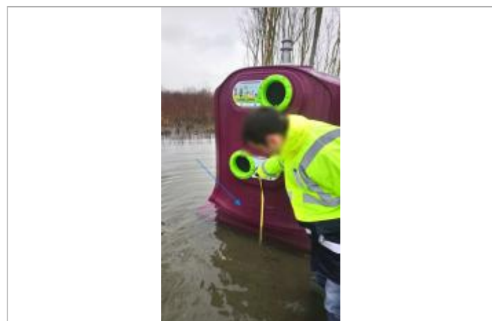
Vue de la marque - SPC SMYL