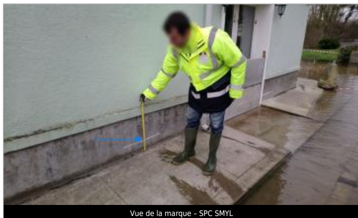
Vue de la marque - SPC SMYL