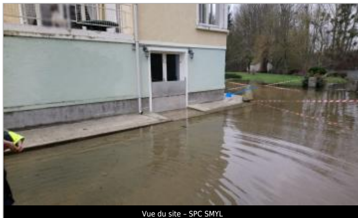
Vue du site - SPC SMYL

Coordonnées WGS84 : X: 3.32880000 / Y: 48.44168000