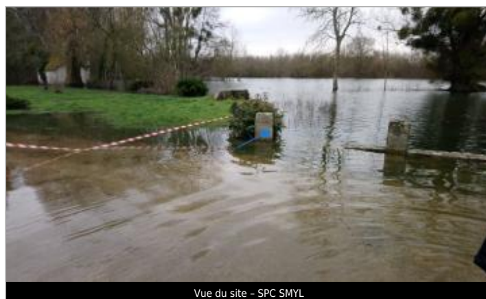
Vue du site - SPC SMYL