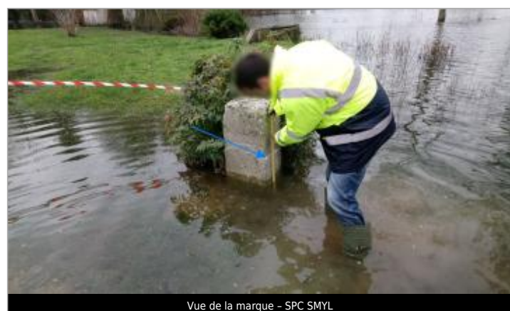
Vue de la marque - SPC SMYL