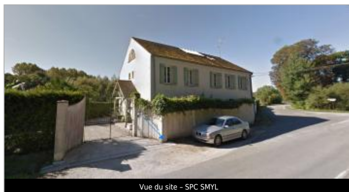
Vue du site - SPC SMYL