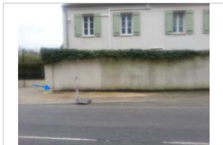
Vue de la marque - SPC SMYL