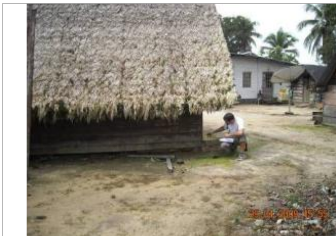
Vue du site - SPC SMYL