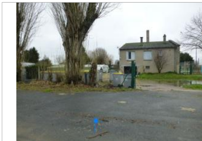
Vue de la marque - SPC SMYL