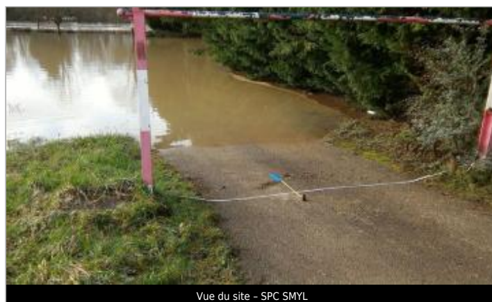
Vue du site - SPC SMYL