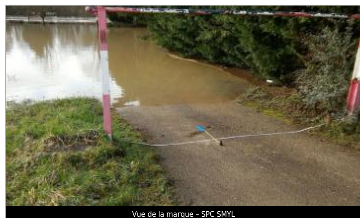
Vue de la marque - SPC SMYL