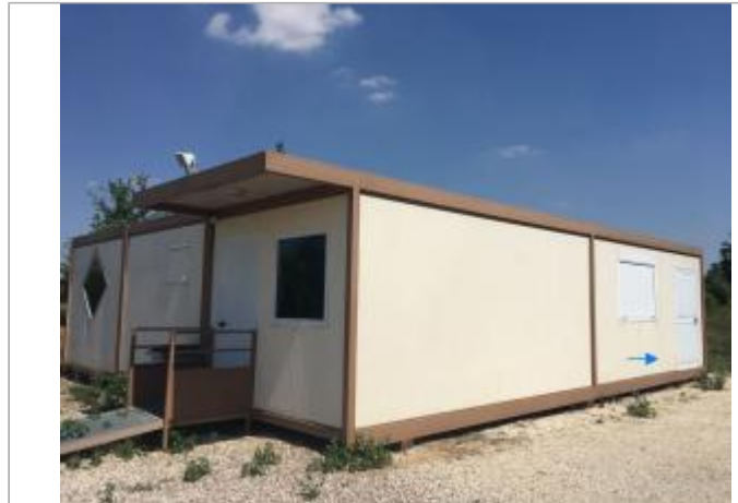
Vue du site - SPC SMYL

Coordonnées WGS84 : X: 3.49562674 / Y: 47.95306471