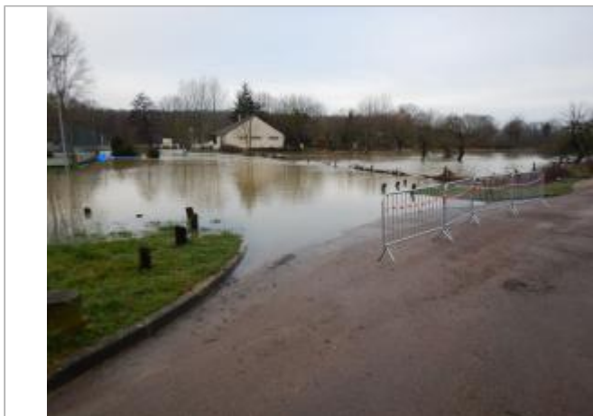
Vue du site - SPC SMYL