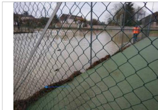
Vue de la marque - SPC SMYL