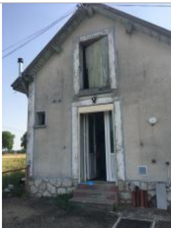
Vue de la marque - SPC SMYL

Altitude calculée de l'eau (en m) : 62.632