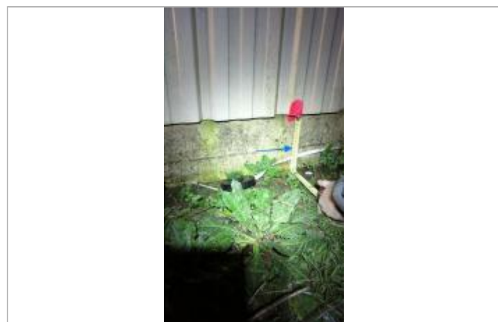
Vue de la marque - SPC SMYL