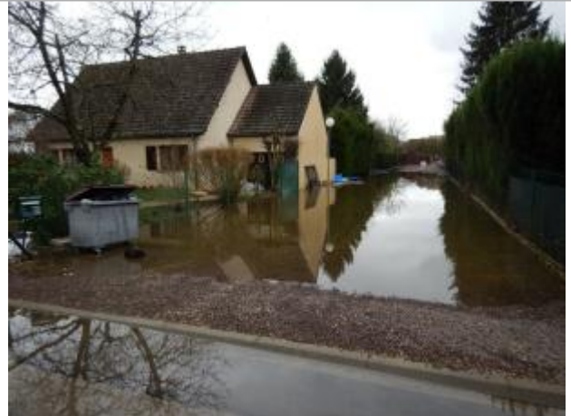
Vue du site - SPC SMYL

Coordonnées WGS84 : X: 3.40123610 / Y: 47.97670531