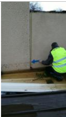
Vue de la marque - SPC SMYL

Altitude calculée de l'eau (en m) : 78.385