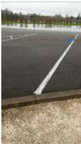
Vue de la marque - SPC SMYL