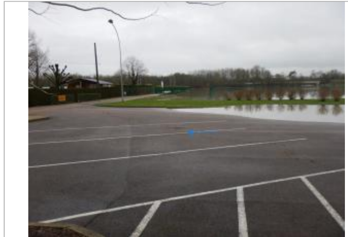
Vue du site - SPC SMYL