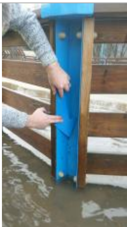
Vue de la marque - SPC SMYL