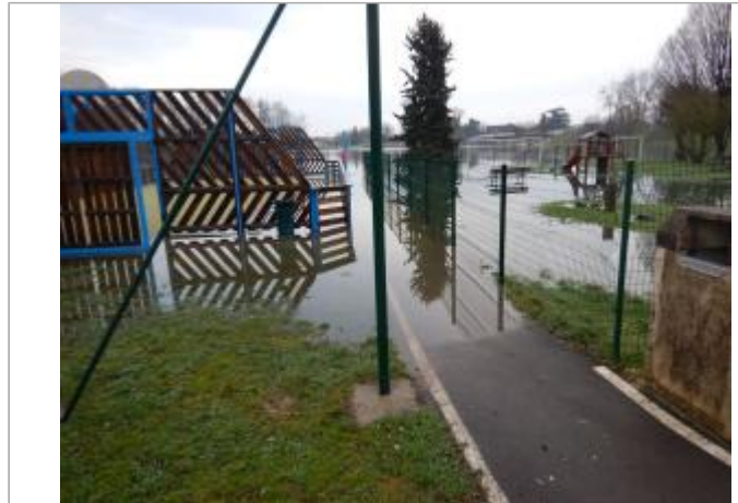
Vue du site - SPC SMYL