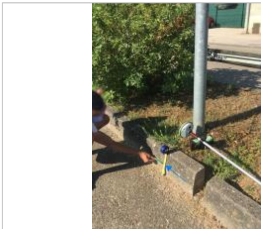
Vue de la marque - SPC SMYL

Altitude calculée de l'eau (en m) : 94.335