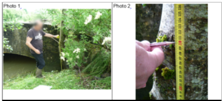
Trace du maximum de la crue sur le tronc de l'arbre à côté du pont sur le chemin communal

MARQUE Texte : Chemin communal Maximum de l'inondation : Oui