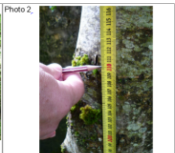
Trace du maximum de la crue sur le tronc de l'arbre à côté du pont sur le chemin communal

SOURCE DE REPÉRAGE : DDT 54 (JUIN 2016) - 15/06/2016 Type de repérage : Campagne de terrain post-inondation