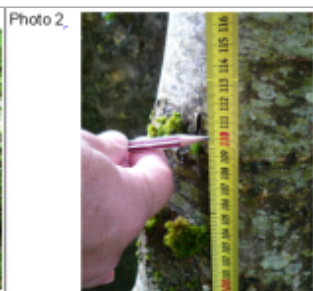
Trace du maximum de la crue sur le tronc de l'arbre à côté du pont sur le chemin communal

SOURCE DE REPÉRAGE : DDT 54 (JUN 2016) - 15/06/2016