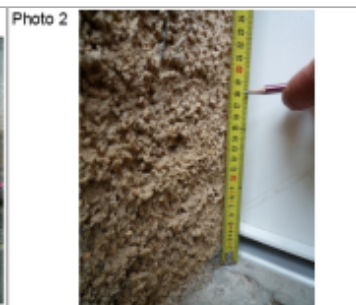
Trace du maximum de la crue sur la façade au coin de la porte d'entrée au 4 rue du lavoir