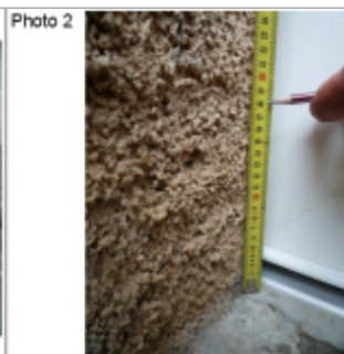
Trace du maximum de la crue sur la façade au coin de la porte d'entrée au 4 rue du lavoir