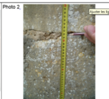
Trace du maximum de la crue sur la façade de la vieille grange rue du lavoir