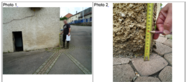
Trace du maximum de la crue sur la façade au coin de l'arue au 6 rue du Lavoir

MARQUE Texte : 6 rue du lavoir Maximum de l'inondation : Oui