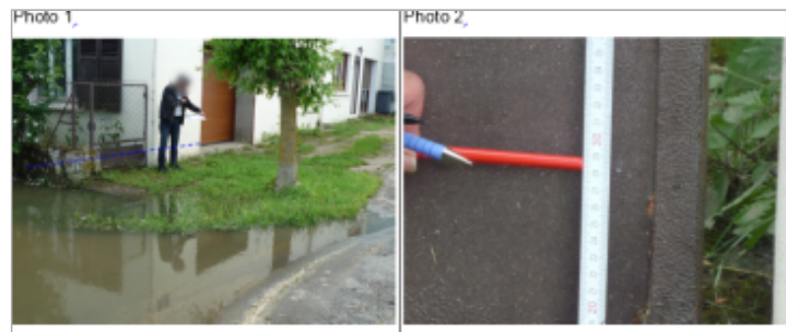
Trace du maximum de la crue sur la porte du jardin du 90 rue de Verdun

GÉNÉRAL Code : WEB_R_201810053517 Date de mise à jour : Auteur : DDT54_PR-GC_MH 06/09/2019