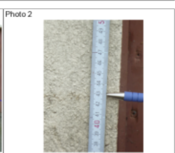
Trace du maximum de la crue sur la façade du 72 rue de Verdun

MARQUE Texte : 72 rue de Verdun Maximum de l'inondation : Oui