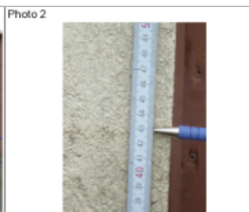
Trace du maximum de la crue sur la façade du 72 rue de Verdun

MARQUE Texte : 72 rue de Verdun Maximum de l'inondation : Oui