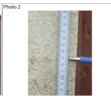
Trace du maximum de la crue sur la façade du 72 rue de Verdun

MARQUE Texte : 72 rue de Verdun Maximum de l'inondation : Oui