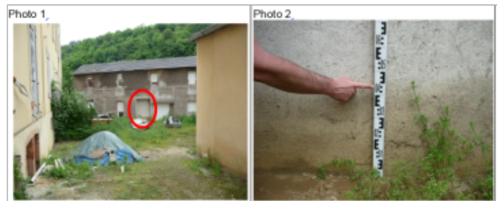
Trace du maximum de la crue sur la façade de la maison place Jean Jaurés

GÉNÉRAL Code : WEB_R_201810054734 Date de mise à jour : Auteur : DDT54_PR-GC_MH 06/09/2019