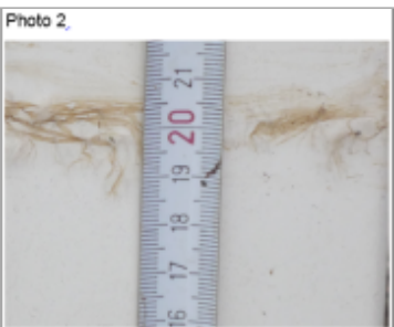
Trace du maximum de la crue sur un poteau de l'abris à caddy du parking du Leclerc