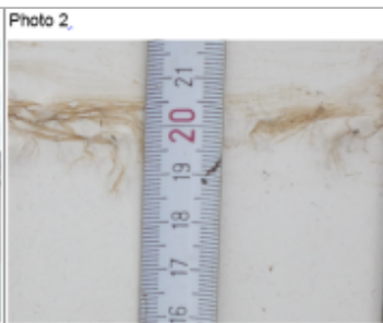
Trace du maximum de la crue sur un poteau de l'abris à caddy du parking du Leclerc