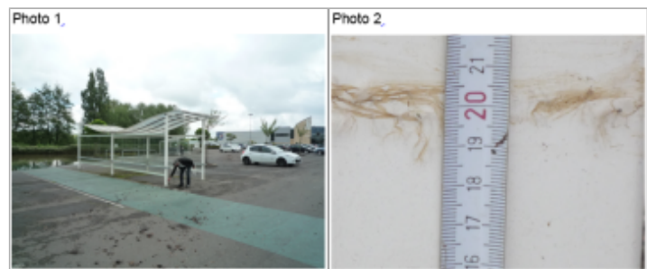
Trace du maximum de la crue sur un poteau de l'abris à caddy du parking du Leclerc

GÉNÉRAL Code : WEB_R_201810052837 Date de mise à jour : Auteur : DDT54_PR-GC_MH 06/09/2019