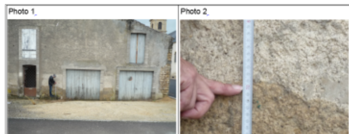
Trace du maximum de la crue sur la façade de la maison du 5 des docteurs Grandjean