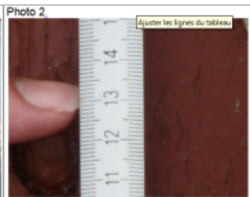
Trace du maximum de la crue sur la porte de garage du 32 rue du général de Gaule