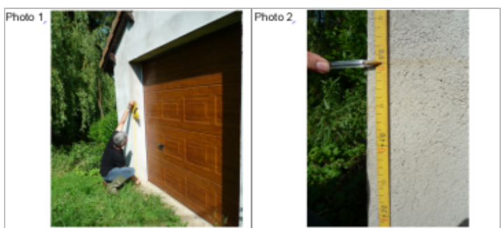
Trace du maximum de la crue sur la façade de la maison à l'angle de la rue de la Fontaine et du chemin rural

MARQUE --- Texte : Maison à l'angle de la rue Fontaine et du chemin rural Maximum de l'inondation : Oui