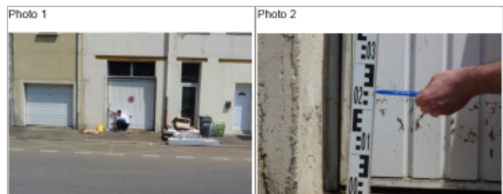
Trace du maximum de la crue sur la façade et la porte de garage du 11 rue de la filature