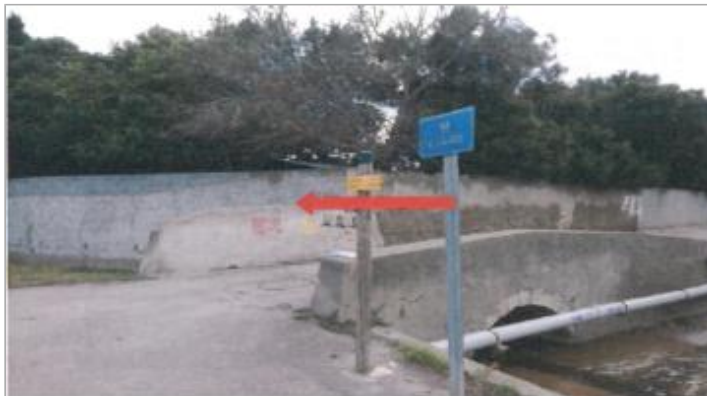
Ouvrage au dessus d'un ruisseau